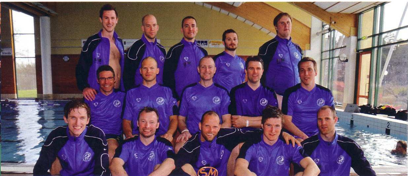
SDK Malmö-Triton tog SM-guld för herrar

Efter att Sydkusten 2008 bröt SDK Malmö-Tritons segersvit på sju raka mästerskap (tangerat rekord, delat av Linköping) återtog SDK Malmö-Triton återigen guld efter en jämn final mot Polisens DK. På damsidan tog det nybildade laget Felix Flix/Musslorna sitt första SM-guld.